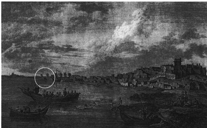
CHOISEUR-GOUFFIER, Voyage pittoresque de la Grèce , v. 1, Paris 1782