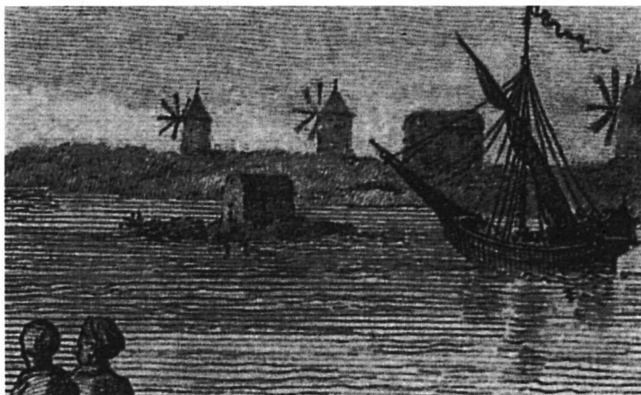
Λεπτομέρεια από τήν ίδια γραβούρα